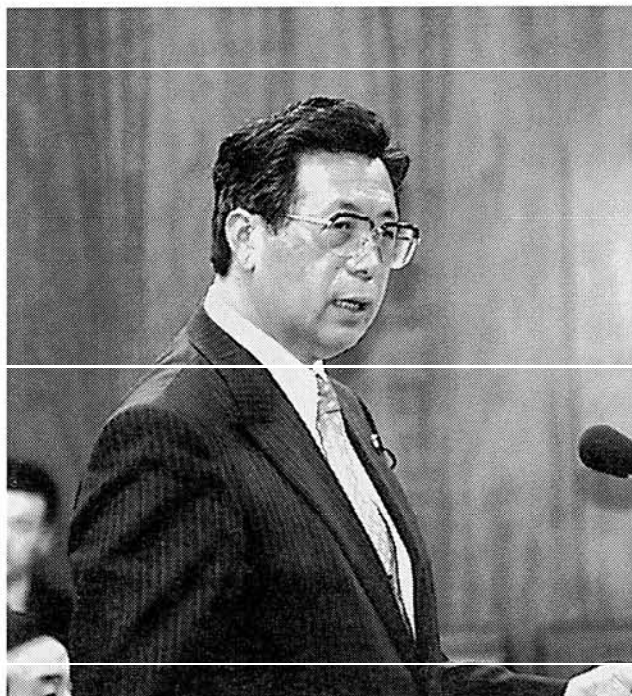
「国を憂う思いは我々も同じ。経験の浅さは熱で補う」(平成19年5月)

職業体験(進路選択)の一年間のうちの大部分、八〜十月を地域の高齢者、または肢体不自由者の福祉施設などで介護の手伝いを行う。 介護士やボランティアの方との会話の中で大人の話、考え方、社会の仕組みなど、新しい知識に接する。また、何よりも介護を受ける人々の実態を目の当たりにし、自分も将来、病氣やケガで、あるいは年をとることに、体が不自由になるかもしれない。そして、介護を受けるようになるかもしれない、という現実を直視し、自分の人生を考えさせられる一年間を過ごすことになりま